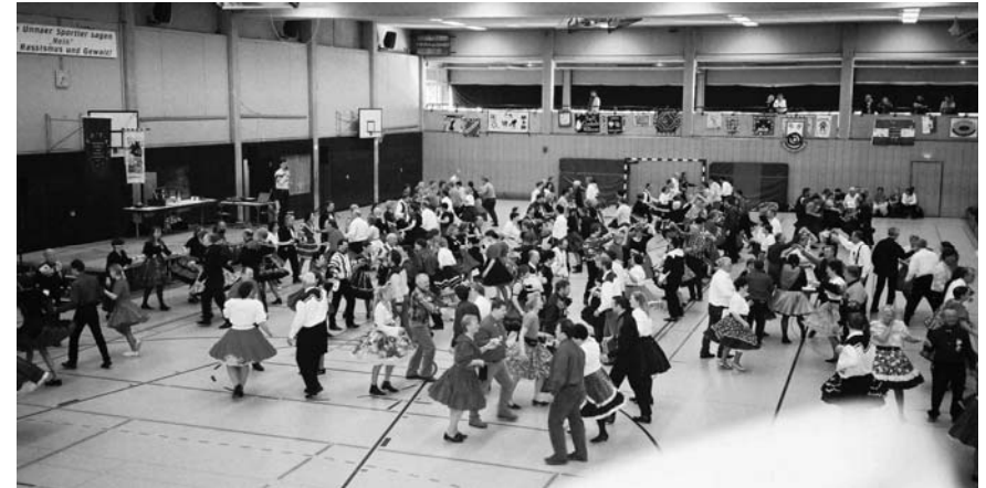
Reges Treiben auf dem Tanzparkett

hauptsächlich nach Unna gefahren sind, stand an diesem Tag leider nicht zur Verfügung, da "seine Schwester heiratet". Nun, offenbar war das eine recht plötzlich Hochzeit. Man sollte mal im Auge behalten, ob es in Zukunft Mode wird, namhafte Caller auf die Flyer eines Specials zu schreiben, die dann plötzlich am Veranstaltungstag aus unerfindlichen Gründen dann doch nicht auftreten (können).