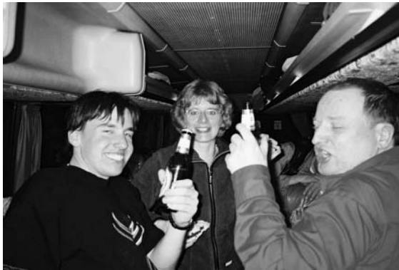
Ausgelassene Stimmung bei der After Party im Bus

verließen uns. Gegen 02.00 Uhr waren wir dann wieder in Bergen-Enkheim, wo sich die ganze Horde fröhlich aber total erschöpft auf den relativ kurzen Heimweg machte.