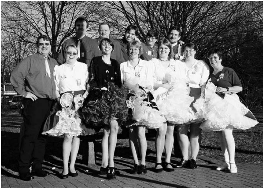
Die Bembels in Unna

Am späten Nachmittag erfuhr die Stimmung einen jähen Dämpfer durch den Auftritt von Joachim Kohlshorn und Brian Gill, die es sich nicht nehmen ließen, zwischen ihren ausgedehnten Laberpausen deutsche und amerikanische Volkslieder, mit Calls bestückt, zum Besten zu geben. Der ein oder andere dachte wohl, daß er nunmehr doch verscheißert wird. Diesen Teil des Programms kann man getrost abhaken. So nutzten wir die freie Zeit, noch ein schönes Mannschaftsbild auf der Wiese vor der Stadthalle machen zu lassen (von Gerhard von den Desperados) und genossen draußen die warme Abendsonne.